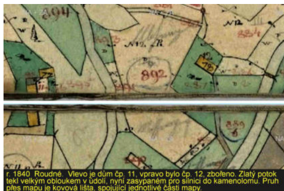
r. 1840 Roudné. Vlevo je dům čp. 11, vpravo bylo čp. 12, zbořeno. Zlatý potok tekl velkým obloukem v údolí, nyní zasypaném pro silnici do kamenolomu. Pruh přes mapu je kovová lišta, spojující jednotlivé části mapy.