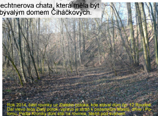
Rok 2014, část rovinky u Zlatého potoka, kde stával dům čp. 12 Roudné. Dál vlevo teče Zlatý potok, vpravo je strán k pozemkům Mastů, dříve i Polomů. Podle Kroniky dům stál na rovince, těsně pod svahem.

Fotografie: Masty- opona a kulisy, podle majitelky fotek. Ochotnické divadlo se asi hrálo v Mastech čp.10 (v hostinci).