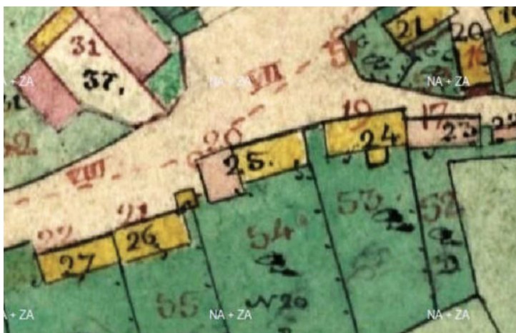
Bílý Újezd - část obce, v roce 1840.

Asi v polovině mapy je zprava doleva, řada domů čp. 17 až 22. Kamenný je pouze dům čp. 17 a kovárna u čp. 20. Ostatní domy jsou dřevěné. Domy stály podél cesty a za nimi byly zahrady. Černé jsou napsaná čísla stavební pozemků.