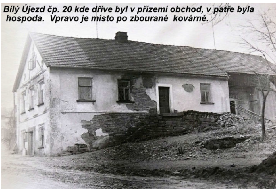
Bílý Újezd čp. 20 kde dříve byl v přízemí obchod, v patře byla hospoda. Vpravo je místo po zbourané kovárně.

Po smrti Kutíkových jejich dům i majetek propadl státu a ten jej předal místnímu JZD. Dolní místnost byla využívána jako sběrna mléka. V horních místnostech bylo skladiště. Dům nebyl obydlený a chátral. Stará kovárna byla v roce 1961 zbořena a později byl upraven i prostor dvora domu, kde byla zřízena příjezdová cesta, k nově postaveným bytovkám.