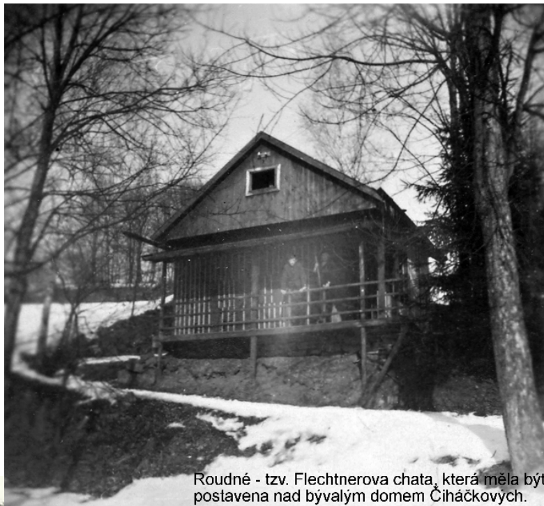
Roudné - tzv. Flechtnerova chata, která měla být postavena nad bývalým domem Čihákových.