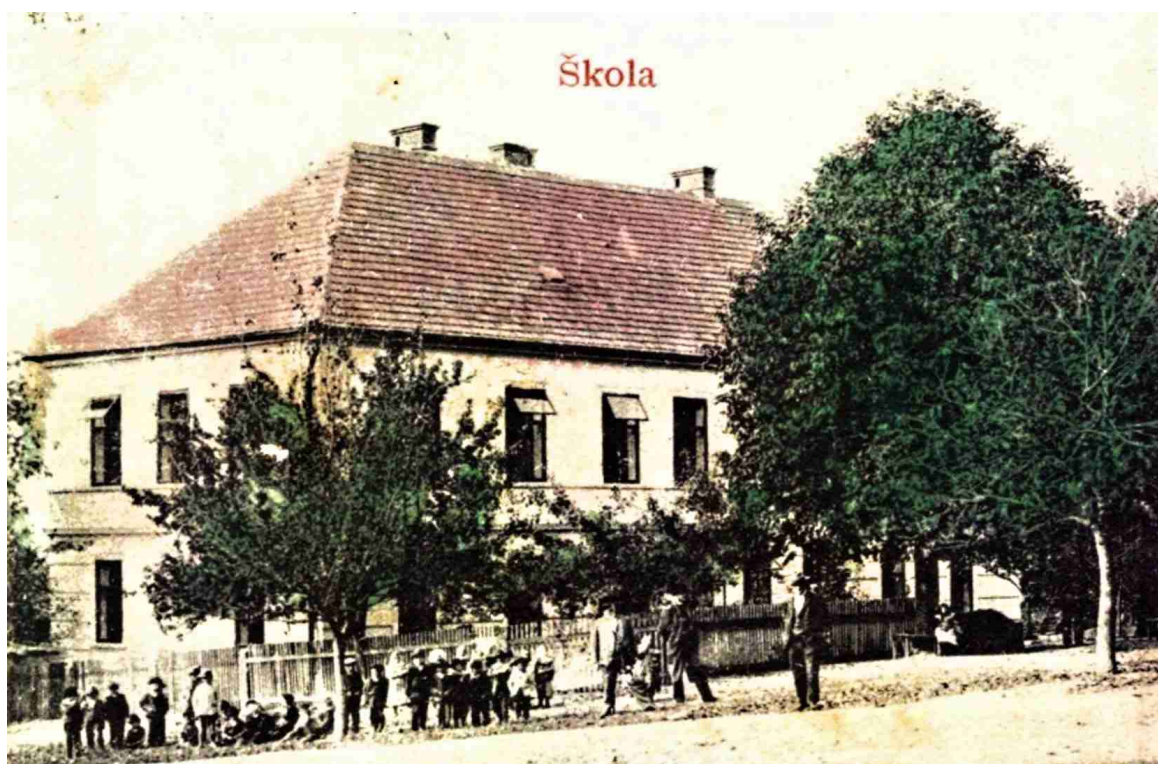
asi rok 1904