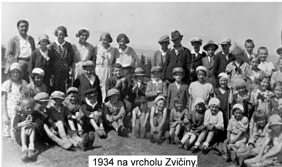
1934 na vrcholu Zvičiny,

.....se k hrdinům Němcové románu Babička. Na újezdeckém hřbitově je hrob, v němž odpočívá „mlynářovic Mančinka“, jež se přivdala do mlýna v Mastech. Když se děti dosyta „vybrodily“ v řece Úpě pod Viktorčiným splavem, nastoupili jsme cestu k domovu v úplném zdraví a svěžesti, obohaceni mnoha dojmy a zkušenostmi, které nám jistě velmi poslouží při vyučování vlastivědě, reáliím, občanské nauce apod.