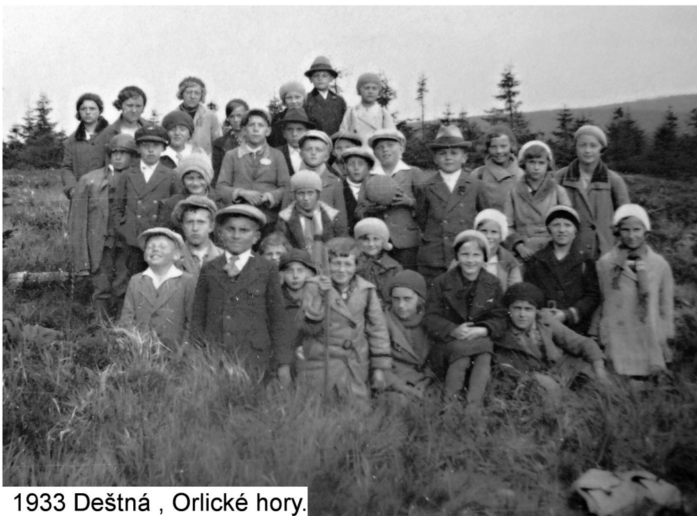
1933 Deštná , Orlické hory.

Poznámka: Na výletě byla 1. třída. 2. třída odjela na 3 dny do Prahy.