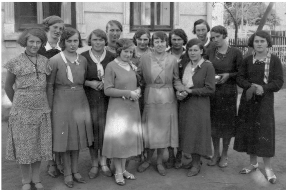
Bílý Újezd Lidová škola hospodářská, 1937 až 1946. Žáci byli z Bílého Újezdu, Hrošky, Mastů, Skalky, Lhoty, Netřeby, celkem asi 30 žáků.