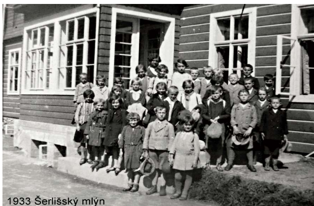
1933 Šerlišský mlýn