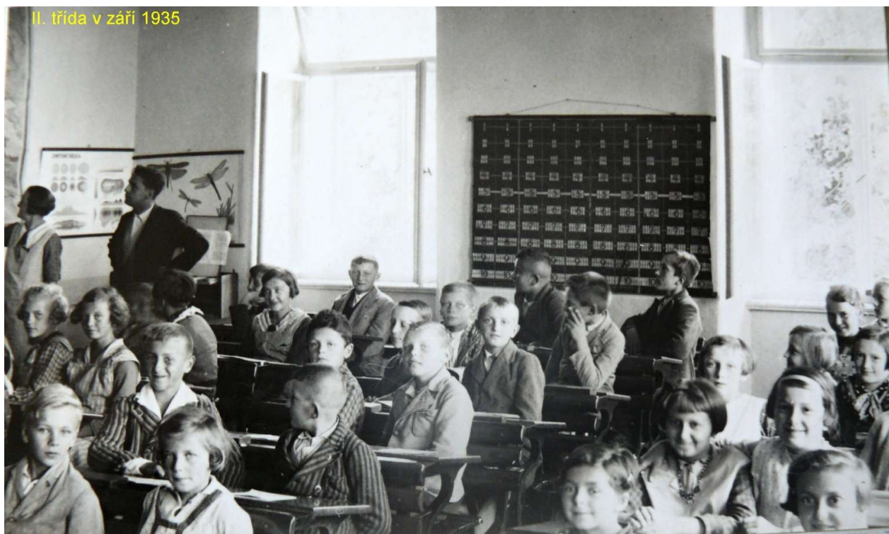
II. třída v září 1935