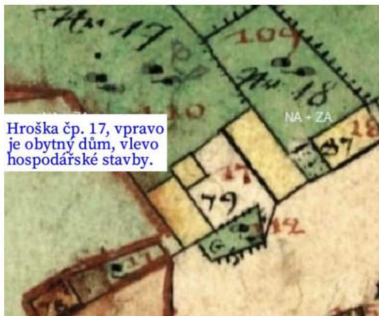
Hroška čp. 17, vpravo je obytný dům, vlevo hospodářské stavby.

V r. 1840 stál dům čp. 17 v Hrošce na stejném místě jako dnes, vpravo u cesty z Bílého Újezda do Trnova. Dnes přibližně proti kapliče. Dům byl dřevěný a stál kolmo k cestě. Vchod do domu byl ze dvora. Přes dvůr, také kolmo k cestě, byla větší hospodářská budova a menší domek. Obě stavby byly dřevěné. Do r. 1900 nebyla na mapě dokreslena stavební úprava domu.