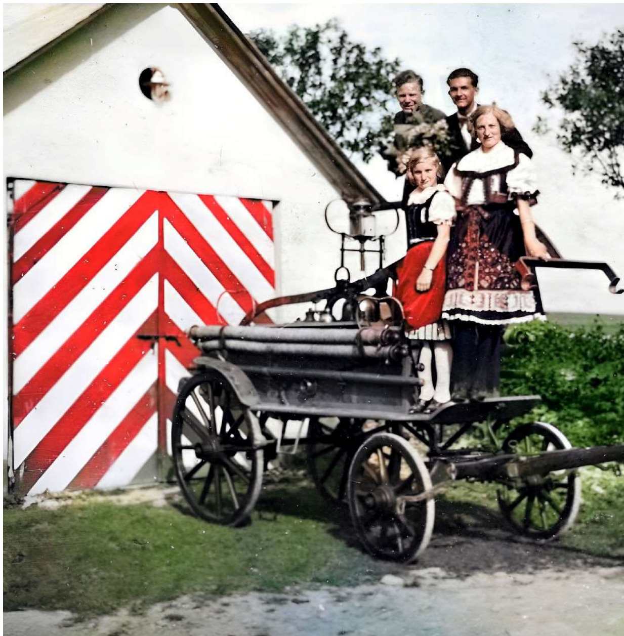
Bílý Újezd asi v roce 1935. Tehdejší požární zbrojnice (dnes kolárna) u cesty do Mastů, se starší hasičskou stříkačkou. (Fotografie upravena kolorováním).

Pro zájemce o historii naší sloučené obce.