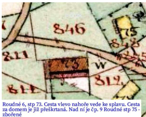
Roudné 6, stp 73. Cesta vlevo nahoře vede ke splavu. Cesta za domem je již přeškrtnaná. Nad ní je čp. 9 Roudné stp 75 - zbořené

V r. 1840 byl dům čp. 6 dřevěný, na stp 73. Vchod byl na dvorek, ze stejné strany jako dnes. K domu patřila i větší hospodářská stavba (stodola) na stp č. 72. Stála asi proti čp. 9, kolmo k cestě, která ale tehdy vedla za domem čp. 6. Do roku 1900 byl celý obytný dům přestavěn. Později byla zbořena i stodola.