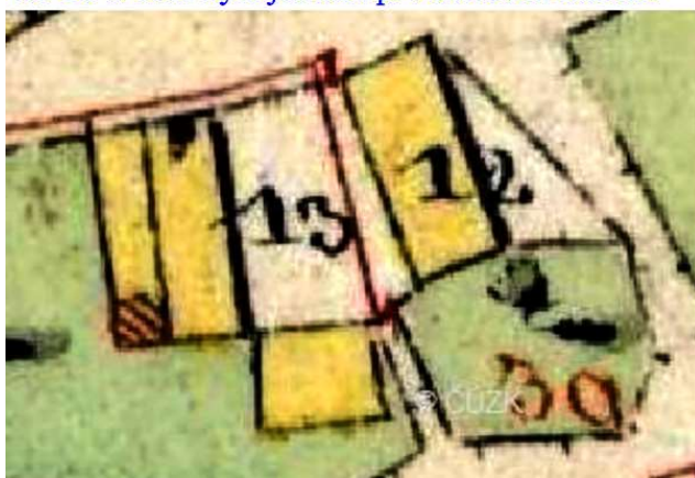
Bílý Újezd čp. 8, stp 12, vpravo a čp. 9, stp. 13, vlevo. Do r. 1900 byla jen na čp. 9 stavební změna.