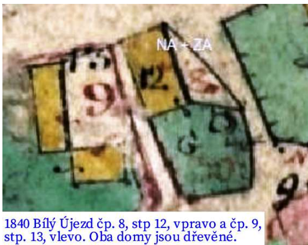
1840 Bílý Újezd čp. 8, stp 12, vpravo a čp. 9, stp. 13, vlevo. Oba domy jsou dřevěné.

V r. 1840 stál dům čp. 8 Bílý Újezd na stejném místě jako dnes, na stp č. 12. Byl dřevěný, obdélníkový. Jiná stavba k domu nepatřila. Tam, kde je dnes stodola, byla malá zahrada, pozemek č. 30. Vchod do domu byl od uličky, stejně jako dnes. Do r. 1900 nebyly zakresleny žádné stavební změny.